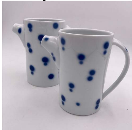
Kannor, Jingdezhen-porslin, kobolt