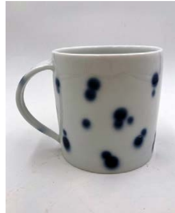
Kopp, Jingdezhen-porslin, kobolt