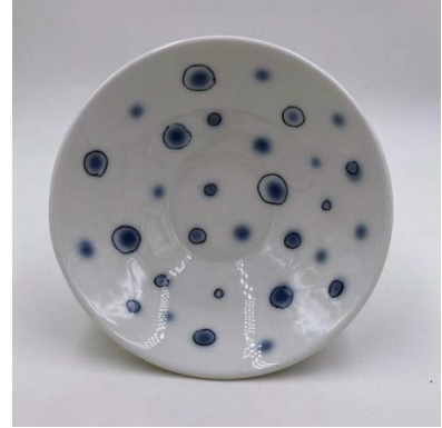
Skål, Jingdezhen-porslin med kobolt