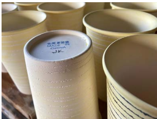
Skröjgods - inläggning av kobolt