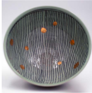
Skål, 'Big Pot Clay' med inlägg av kobolt och guld