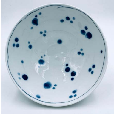
Skål, Jingdezhen-porslin med kobolt