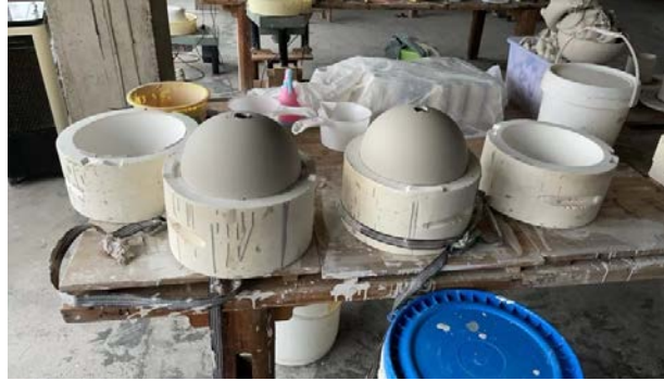
Processen för gjutning av tulipier