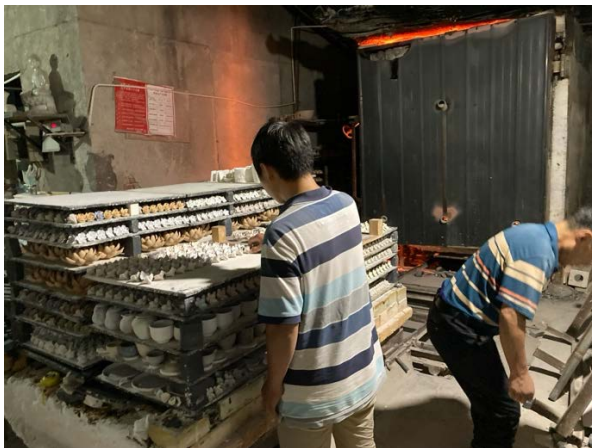
Offentlig ugn i Sculpture Factory

Jag anpassade mina nuvarande produktionsmetoder genom att använda de verktyg, material och tekniker som fanns tillgängliga i Jingdezhen och vid The Opposite Studio. Dock visade sig Jingdezhen's porslinslera vara svår att arbeta med – den var för mjuk för drejning, torkade ojämnt och deformerades lätt vid bränning. Jag bytte snart till jigger-jolly-lera, som hade lägre vattenhalt och var något lättare att hantera men fortfarande temperamentsfull. Jag experimenterade också med “big pot clay”, en något grövre porslinslera. Med dessa leror skapade jag flera välbekanta former, inklusive koppar och skålar.