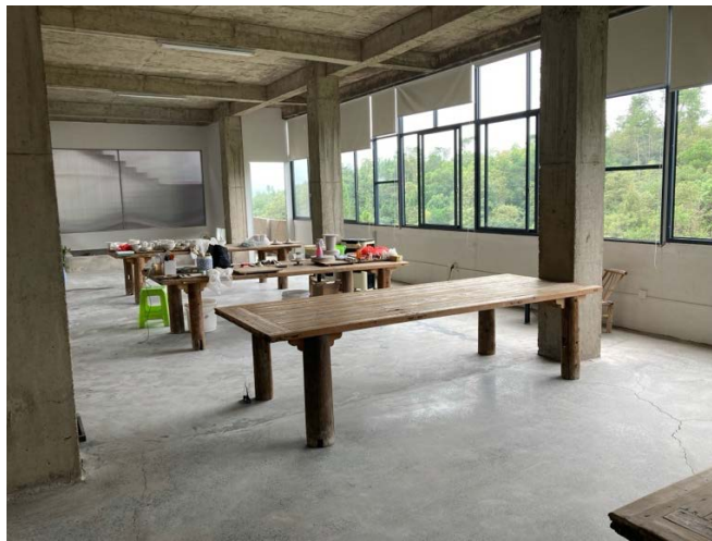
The Opposite Studio, Zhushan District, Jingdezhen

Beläget i Zhushan-distriktet, erbjöd The Opposite Studio en välutrustad miljö för experiment och arbete med porslin. Studion hade flera ugnar, gjutningsmöjligheter och en arbetsyta med utsikt över ett jordbruksområde. Mitt gästrum var bekvämt, och residentet drevs av Sky och Wei, som gav tillgång till verktyg och material. Jingdezhen var överväldigande, med ett enormt utbud av glasyr- och verktygsbutiker, hantverksmarknader och en omfattande keramikkultur synlig i allt från gatudekorationer till antikmarknader.