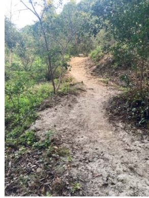
En av flera stigar vid Gaolin / Kaolin