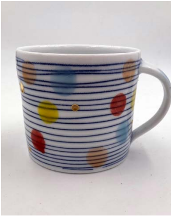
Kopp, Jingdezhen-porslin, inlägg av kobolt, polykrom glasyr, guld