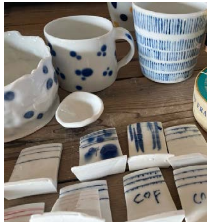
Inledande testresultat med olika former / tillämpningar av kobolt