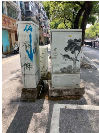
Dekorerade elskåp i stil med porslinsmålning