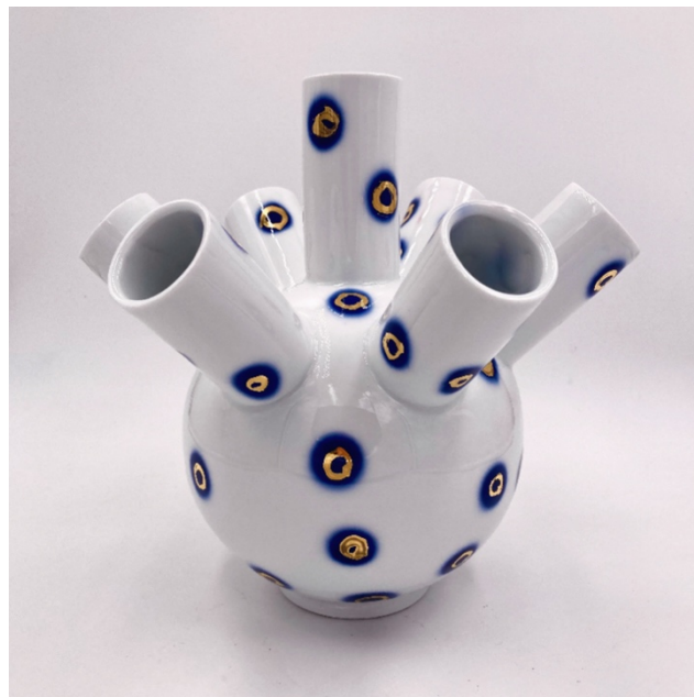
Tulipier, Jingdezhen-porslin med kobolt och guld