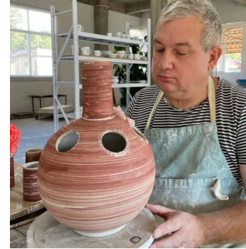
Montering av tulipier