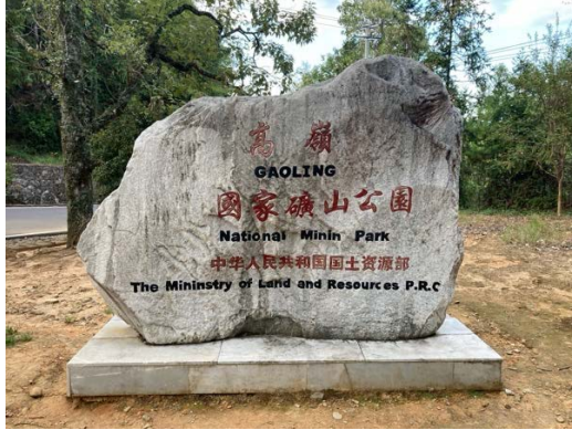
Minnesmärke – Gaolin / Kaolin