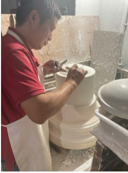
Mästergjutare som formar modergjutformen i gips