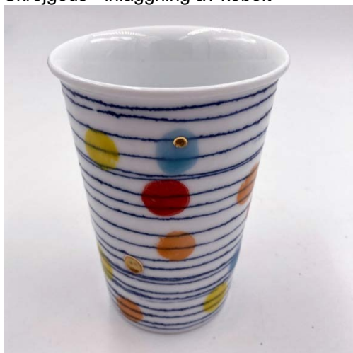
Made in China-serien, upplaga om femtio. Färdigskräjgods, inläggning av kobolt, kobolt-underglaze-dekal, polykrom glasyr, guld